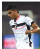
Emerson Palmieri Difensore Roma Al Palermo nella stagione 2014-2015