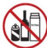
Bottles*, jugs, cans, glass, etc.