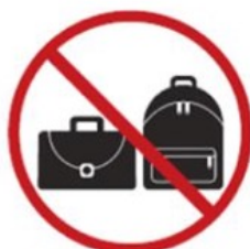
Bags larger than A4

Le norme di condotta da osservare fanno riferimento al regolamento d'uso dello Stadio Olimpico disponibile sul sito della AS Roma e al codice di condotta per gli spettatori disponibile sul sito della UEFA. Di seguito una lista (non esaustiva) degli oggetti vietati: