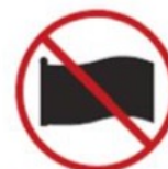
Flags larger than 2.0m x 1.5m (6.5' x 5.0')