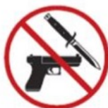
Weapons, explosives, knives, or anything that could be adapted for use as a weapon