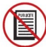
Promotional or commercial objects or materials