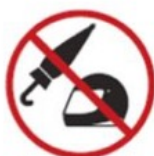
Umbrellas and helmets