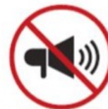
Mechanical or electronic sound-emitting devices, such as megaphones