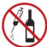
Alcoholic drinks and drugs*