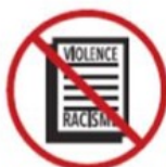
Racist, xenophobic, political and religious propaganda materials