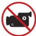
Professional cameras or video cameras