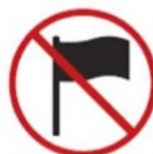
Flagpoles more than 1m in length and 1cm in diameter