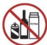
Bottles*, jugs, cans, glass, etc.