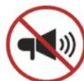
Mechanical or electronic sound-emitting devices, such as megaphones