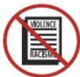
Racist, xenophobic, political and religious propaganda materials