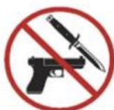
Weapons, explosives, knives, or anything that could be adapted for use as a weapon