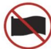
Flags larger than 2.0m x 1.5m (6.5' x 5.0')