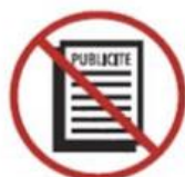
Promotional or commercial objects or materials