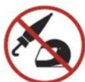
Umbrellas and helmets