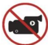
Professional cameras or video cameras