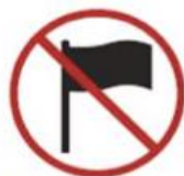
Flagpoles more than 1m in length and 1cm in diameter