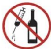
Alcoholic drinks and drugs*